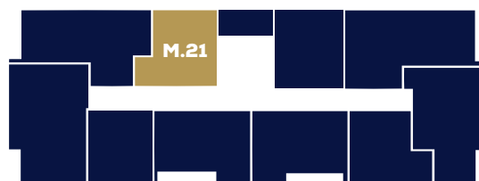
Budynek B1 Piętro II

— - możliwość demontażu lub przesunięcia ścian