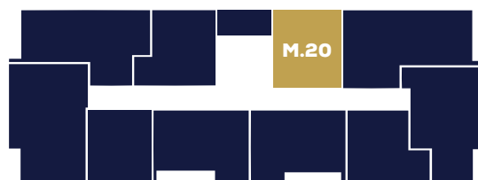
Budynek B1 Piętro I

Karta mieszkania została opracowana na podstawie projektu budowlanego. Prezentowane materiały nie stanowią oferty handlowej, należy je traktować poglądowo.