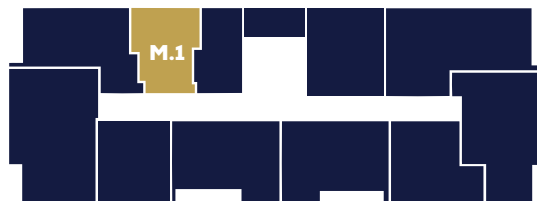
Budynek B1 Parter

— - możliwość demontażu lub przesunięcia ścian