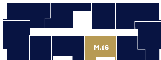
Budynek B1 Piętro I

Karta mieszkania została opracowana na podstawie projektu budowlanego. Prezentowane materiały nie stanowią oferty handlowej, należy je traktować poglądowo.